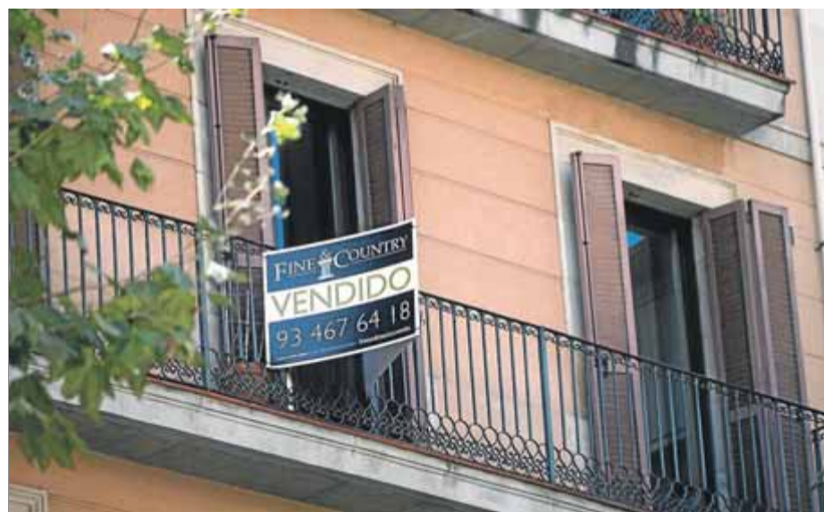
A Catalunya hi va haver més de 76.000 transaccions immobiliàries el 2017

Malgrat els bons resultats de l'any, les vendes van caure del 5,7% durant el mes de desembre, quan el nombre d'operacions va ser de 4.547, un fet que el gerent de la Cambra de la Propietat Urbana de Bar-